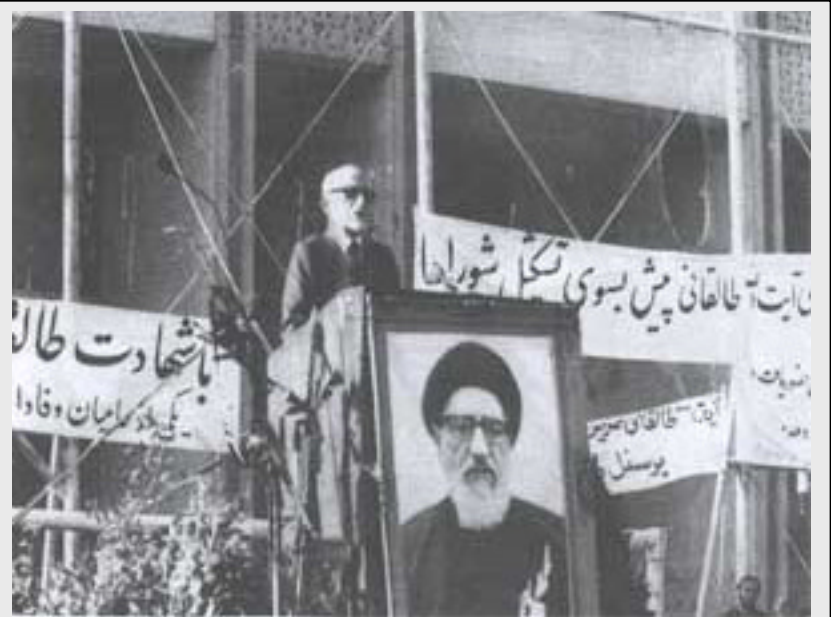
مهندس بازرگان در مراسم بزرگداشت شادروان آیت‌الله طالقانی